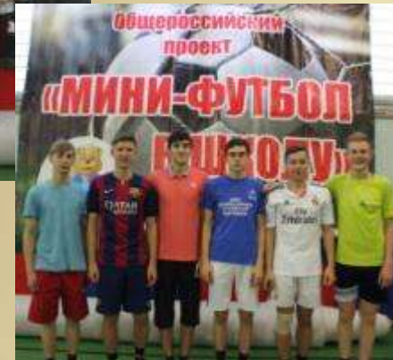
5 место – 1998-1999 г.р.