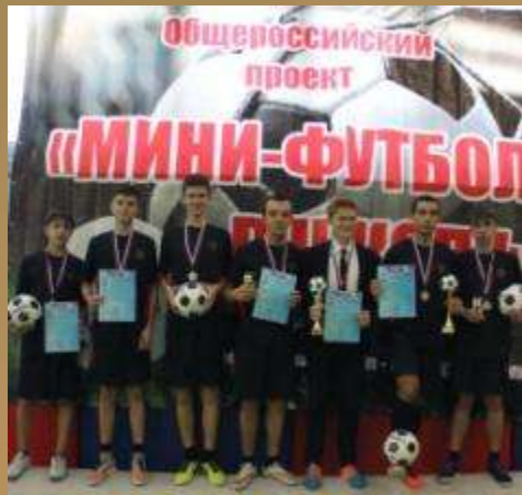
ПОБЕДИТЕЛИ 2000-2001 г.р.