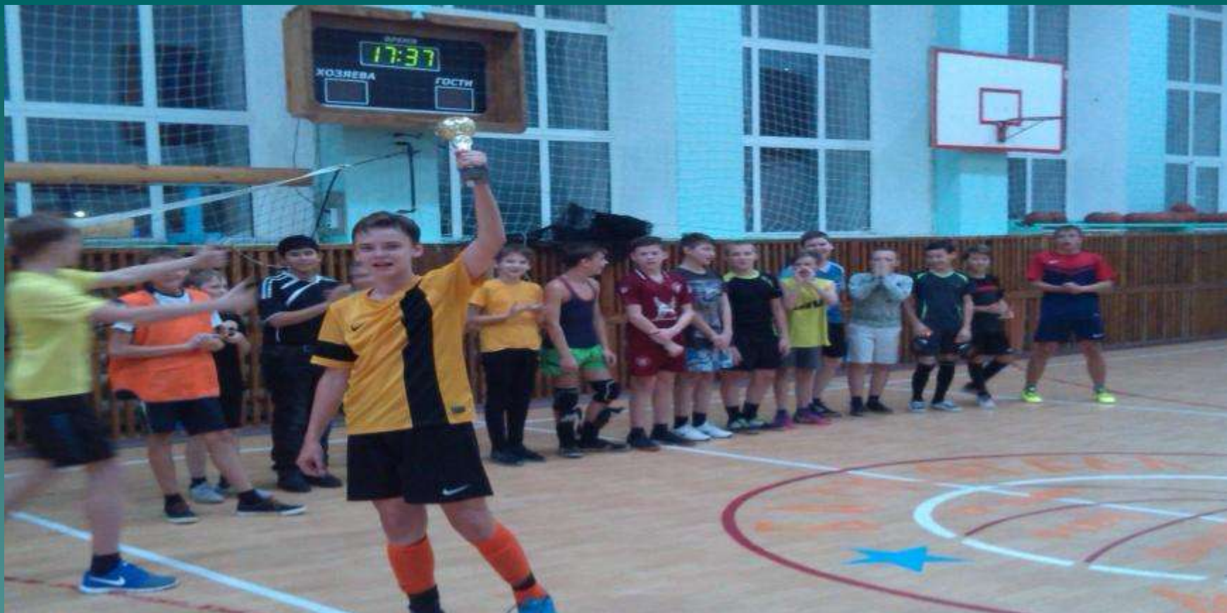
Кубок по мини-футболу, 22 участника