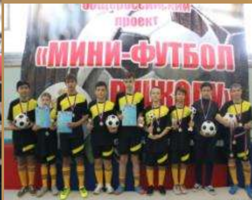
ПОБЕДИТЕЛИ 2002-2003 г.р.