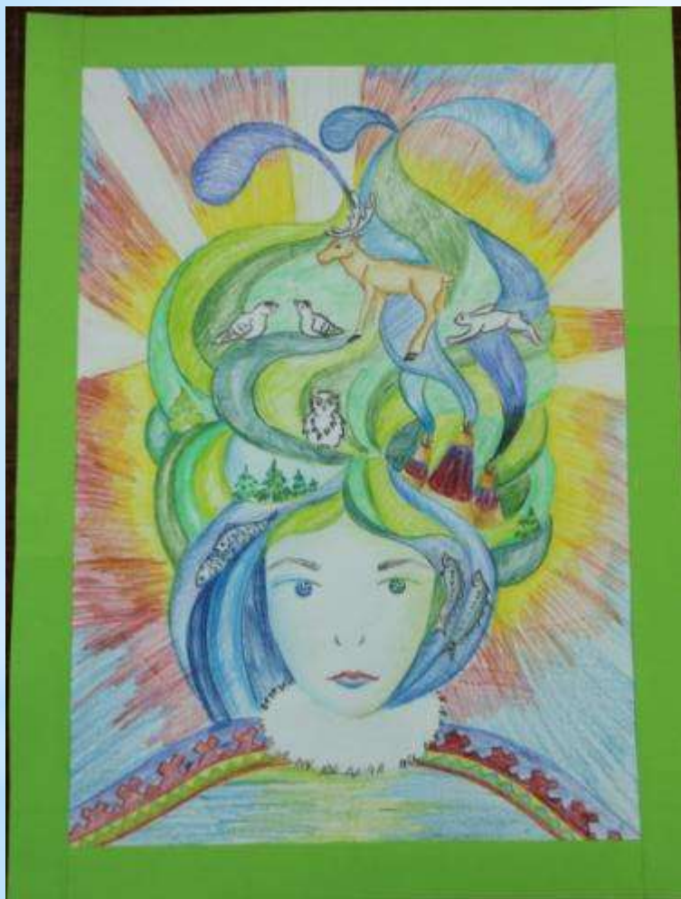
Сова Елена «Дух земли»