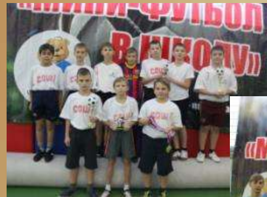
4 место – 2004-2005г.р.