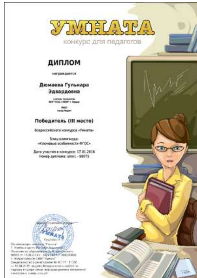
Всероссийский конкурс «Умната»