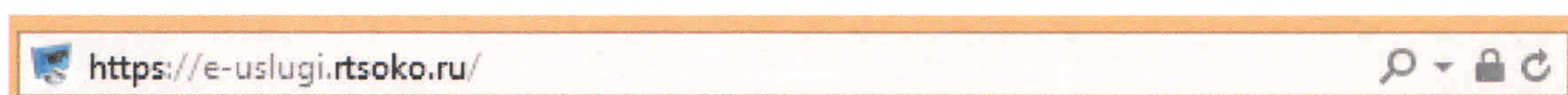
Рисунок - 1. Адрес Портала в адресной строке браузера

1. Для регистрации заявления зайдите на портал, введя в адресной строке браузера его адрес https://e-uslugi.rtsoko.ru/ (рисунок №1, №2)